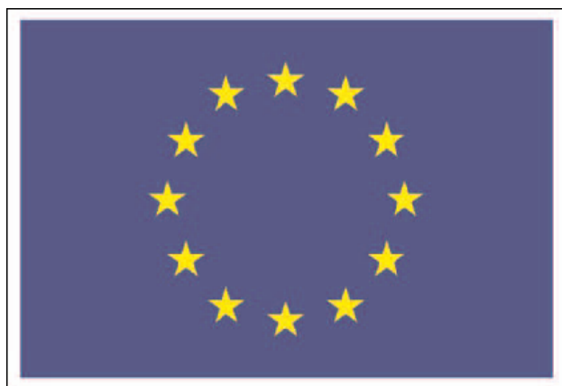
Simbolul Uniunii Europene, color